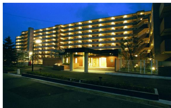
さいたま市 B アネーロ

ものづくりに情熱を傾ける「想い」を、 新たな未来を切り拓く「志」を、 地域を愛する「心」を、 共有できる新しい仲間を求めています。