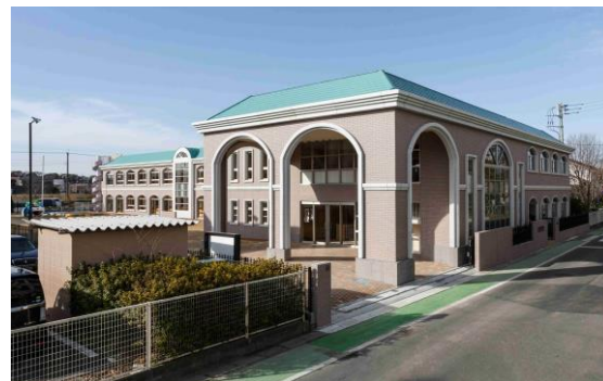
さいたま市 S 幼稚園