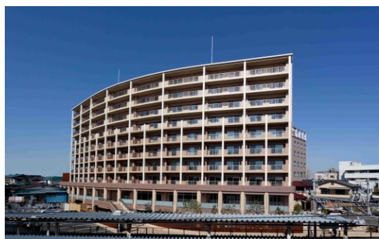
蓮田市 O プラザ